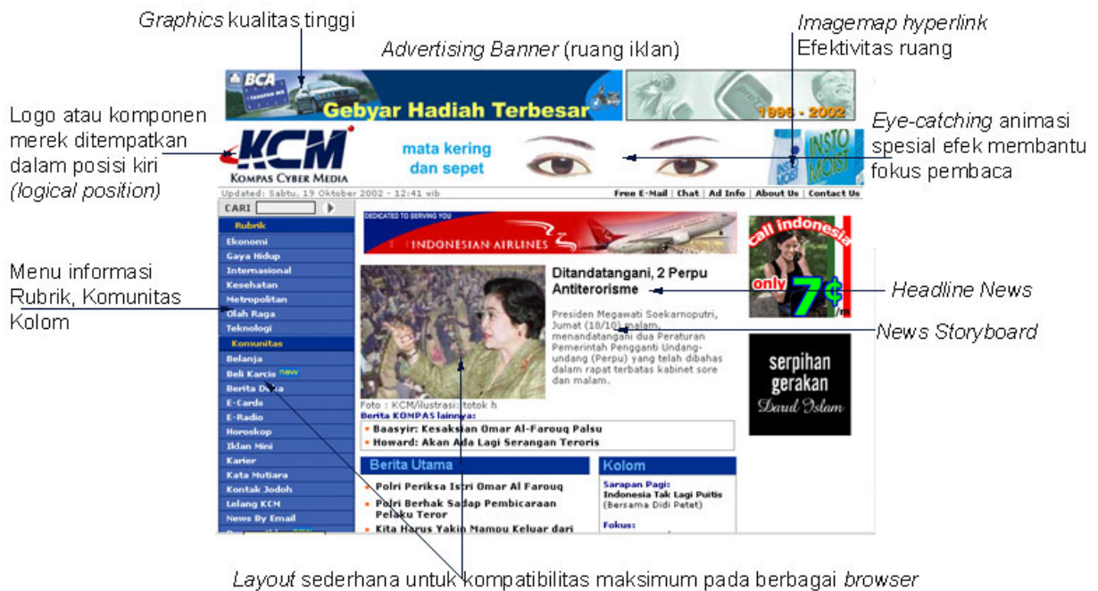
Contoh tampilan online news di Kompas.com berikut dengan elemen desain

Berita online di Indonesia umumnya dimiliki dan dikembangkan oleh nama-nama surat-kabar dan majalah besar, yang sebelumnya sudah eksis secara cetak dan kuat secara modal serta jaringan distribusi. Dimana para pemilik koran dan majalah menerbitkan edisi online sebagai tuntutan kemajuan jaman yang serba cepat dan instan, apalagi adanya revolusi luar biasa di bidang Teknologi Informasi dan Komunikasi. Karenanya, dengan menggunakan protokol dan teknologi internet, yang menghubungkan sistem jaringan komputer global, diseminasi berita dapat dengan cepat dan seketika. Kompas.com , Media-indonesia.com , Bisnis-indonesia.com , Suarapembaruan.com , Jawapos.com , Surya.co.id , Suaramerdeka.com , Republika.co.id , Detik.com , Tempo.co.id , Gatra.co.id , Forum.co.id , Tiara.co.id , Wartaekonomi.co.id , dan sebagainya adalah beberapa contoh penyedia layanan berita online ( News Service Provider ) terkemuka dan terpercaya di Indonesia.